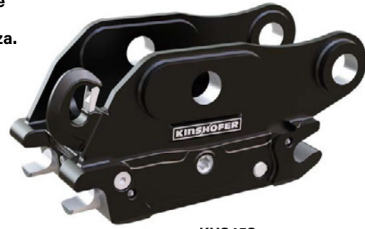
KHS45S qui con il gancio

Il Sistema S-Lock è stato progettato per essere completamente compatibile con gli adattatori dello standard S adottato a livello internazionale. Oltre al suo meccanismo di blocco, progettato appositamente e situato in posizione centrale, l'attacco S-Lock dispone di un secondo meccanismo di blocco sul perno frontale, in modo da offrire un doppio sistema di blocco atto a garantire la massima sicurezza.