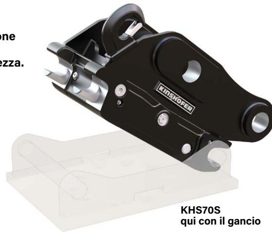
KHS70S qui con il gancio